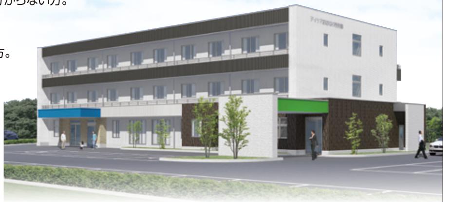
※すべての写真はイメージです。